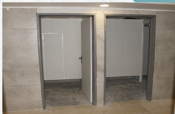
بعد از تعمیر