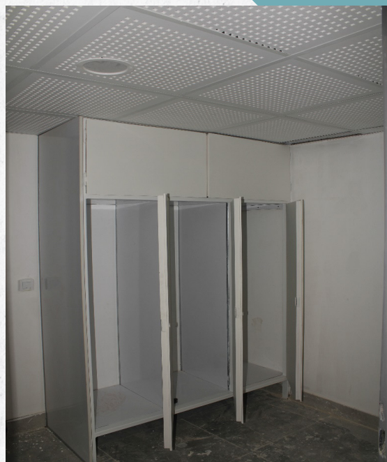
بعد از تعمیر