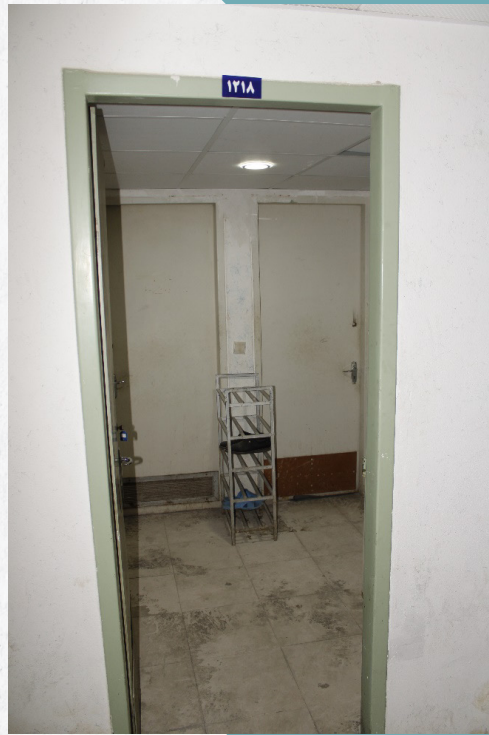
قبل از تعمیر