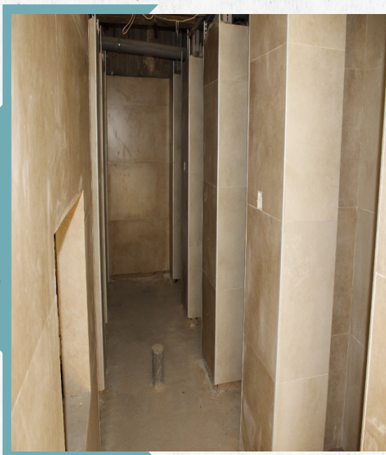
بعد از تعمیر