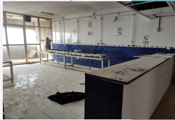
قبل از تعمیر