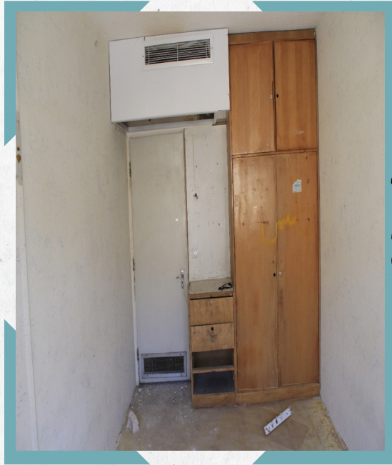
قبل از تعمیر

وجود کمد‌های چوبی و قدیمی درون هر اتاق علاوه بر آن که مشکلات بهداشتی برای ساکنان ایجاد می‌کرد؛ این کمد‌ها فرسوده و بعضاً شکسته شده بود. از طرفی تعداد کمد‌ها متناسب با تعداد ساکنان نبوده و همچنین بخشی از فضای مفید اتاق اشغال شده و موجب عدم آسایش ساکنان می‌گردید. بدین ترتیب حذف این کمد‌ها و جایگزین کردن کمد‌های مناسب ضروری به نظر می‌رسید. در حال حاضر کمد‌های نو با طرح و تعداد جدید در فضای لابی اتاق نصب شده است و امید است که رضایت ساکنان را به ارمغان آورد.