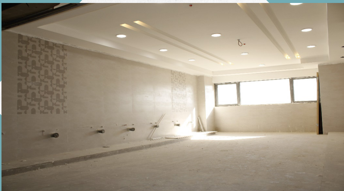
بعد از تعمیر