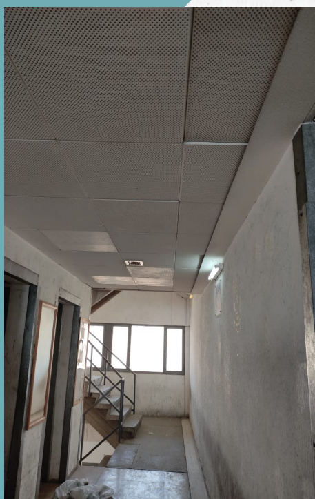
قبل از تعمیر

برای پوشش دیوارهای راهروها و راه پله‌های اضطراری از بهترین و جدیدترین نوع کاشی و سرامیک استفاده شده است. همچنین سعی شده است با به کار بردن طرح‌های مختلف در آن به زیبایی آن افزوده شود. یکی از مشکلات دیوارهای گچی راهروها در گذشته عدم امکان نصب کاشی و سرامیک روی آن بود و با قرار گرفتن در مجاورت رطوبت سرویس‌های بهداشتی و پوشیدن دیوارها این مشکل دو چندان شده و وجهی خوابگاه را نامطلوب می‌نمود.